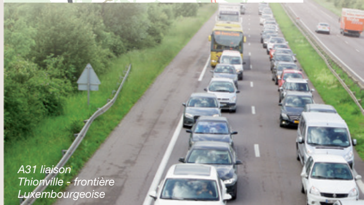
A31 liaison Thionville - frontière Luxembourgeoise