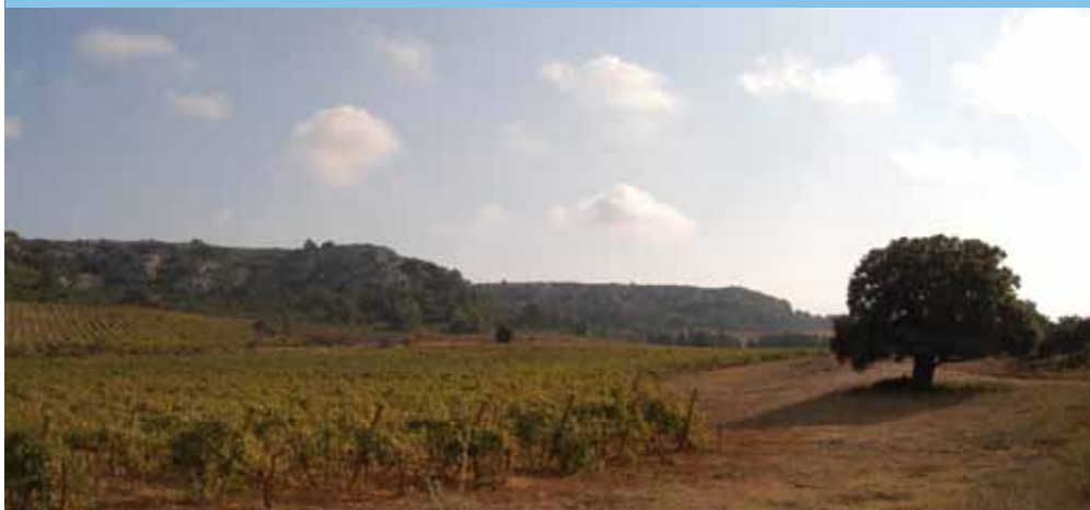
Vignoble Massif de la Clape

Véritable ressource alternative, le transfert d'eau du Rhône vers le Languedoc-Roussillon via le projet Aqua Domitia reflète la capacité des acteurs du développement régional à se fédérer autour d'un projet nécessaire pour affaiblir le déséquilibre hydrologique, positionner notre économie régionale sur les marchés mondiaux (commercialisation de productions vitivinicoles et savoir-faire industriel), promouvoir le Languedoc-Roussillon sur la scène économique européenne.