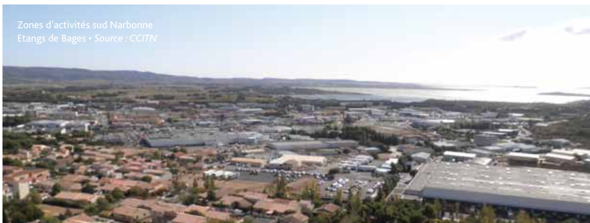
Zones d'activités sud Narbonne Etangs de Bages

Ce projet prospectif qui poursuit initialement l'objectif de sécurisation de l'alimentation en eau potable, participera, au premier plan, à la sécurisation de notre avenir économique.