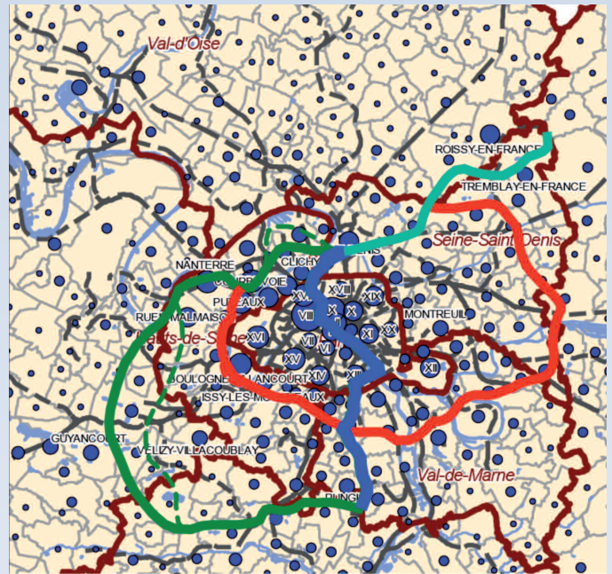
Carte de localisation des emplois salariés privés au regard du tracé du projet de métro automatique.