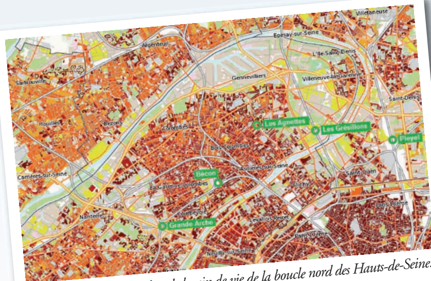
Densité de population dans le bassin de vie de la boucle nord des Hauts-de-Seine.

Une carte schématisant le territoire de la boucle nord des Hauts-de-Seine. Le territoire est représenté en bleu clair, avec des lignes orange indiquant les limites des villes et les axes de transport. Les gares de Bécon, Les Agnettes et Les Grésillons sont marquées avec des points verts et des étiquettes.