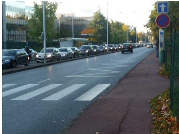
Vélizy Zone d'Emplois - Rue Grange Dame Rose un jour d'octobre 2010 à 9 heures du matin