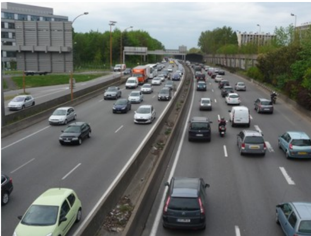
Meudon la Forêt - RN 118 - avril 2010 (18 heures)

On arrive plus précisément à une répartition par mode de transport (source questionnaire salariés été 2010, 7200 réponses): 55 % viennent en voiture, 27 % en transport en commun (public ou navette d'entreprise), 9 % en moto, 4 % à pied ou à vélo et 5 % recourent au covoiturage.