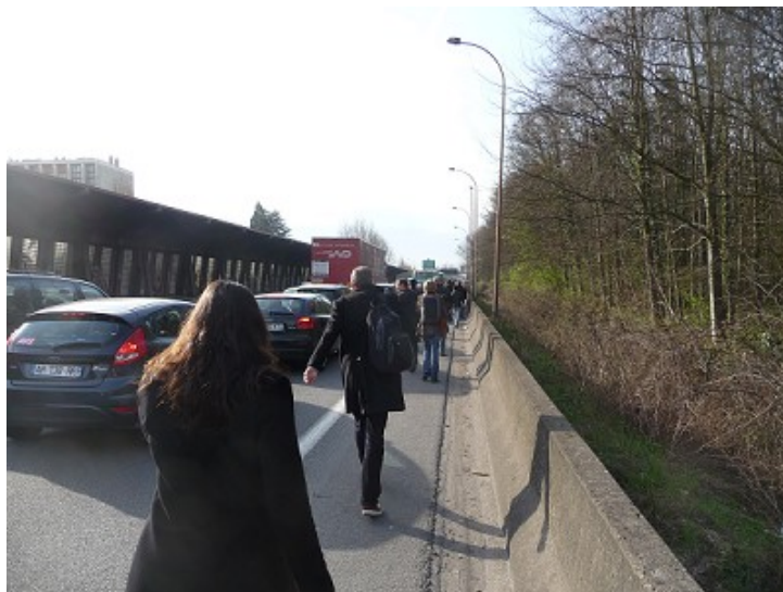
7 avril 2010 - accès à Vélizy par la RN 118 complètement congestionné : les passagers des bus venant du pont de Sèvres sont invités à descendre sur la bande d'arrêt d'urgence de la RN 118 et à terminer à pied

repandre un exemple récent), le moindre incident (véhicule en panne, zone de travaux localisée, ...) sur l'un des deux axes suffit à paralyser la circulation dans tout le secteur, voirie locale comprise.