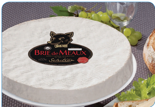
Fromagerie RENARD GILLARD à Biencourt-sur-Orge

L'activité économique du territoire de la Communauté de Communes de la Haute Saulx est principalement industrielle et agricole, en lien direct avec la valorisation des ressources et des savoirs faire locaux et historiques (fromagerie, fonderie, filière bois...).