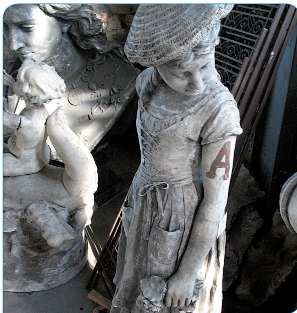
Pôle d'Excellence Rurale d'Ecurey

Même si le territoire de la Haute Saulx n'a pas la volonté d'accueillir l'ensemble du développement résidentiel lié au projet Cigéo, l'objectif de la Communauté de Communes de la Haute Saulx est cependant de répondre favorablement à la nécessité d'accueillir de nouveaux résidents. Cela passe notamment par la création de conditions d'accueil propices à l'implantation de