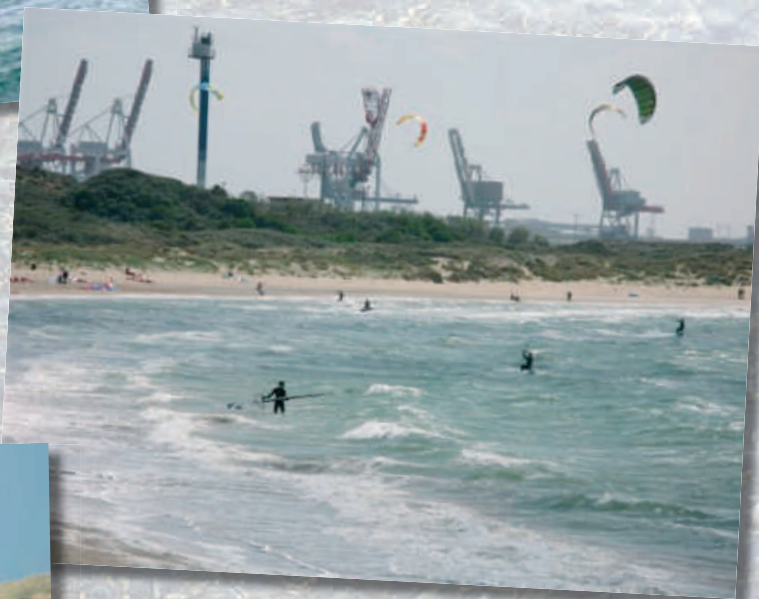
◀ Il y a ces jours, où l'on navigue seul mais en sûreté au Clipon...