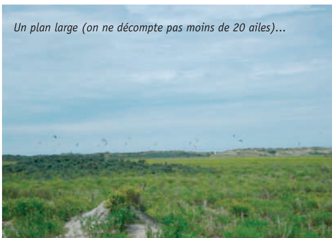
Un plan large (on ne décompte pas moins de 20 ailes)...