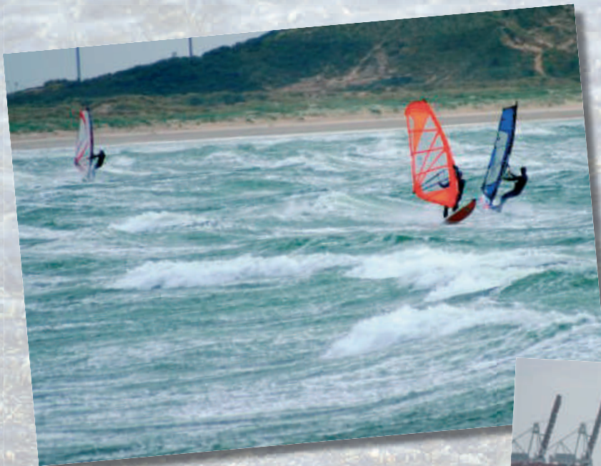
◀ Le Clipon par vent fort, utilisé par nos "cousins" windsurfers