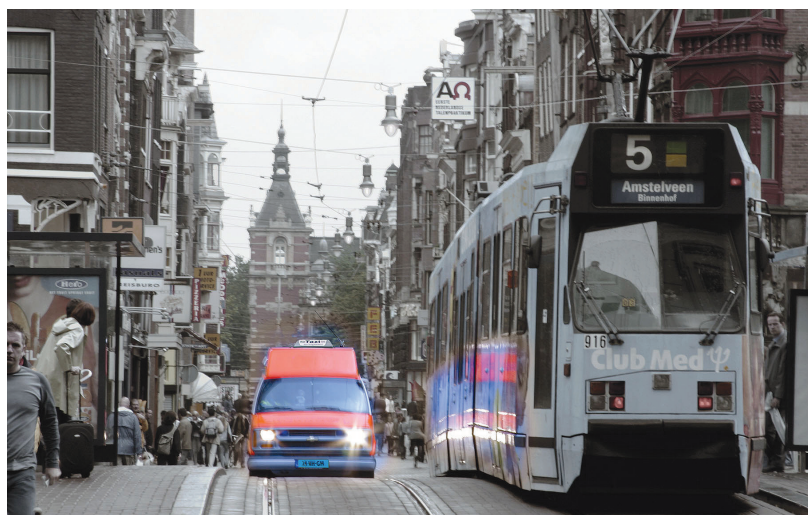
Amsterdam : la mixité des infrastructures de transports publics fait partie du décor hollandais.

Pour ne retenir que deux exemples dans le cadre de ce bref mémorandum, citons tout d'abord un cas de cohabitation réussie à Saint-Étienne où les taxis peuvent rouler sur la majeure partie des voies du tramway sans que cela nuise à sa vitesse commerciale. À l'inverse, l'exemple à ne pas suivre est celui de Nancy où le tramway n'a pas désengorgé la ville, bien au contraire, la ligne de tramway créant une scission de l'espace urbain qui bloque la circulation automobile transversale et donc les taxis.