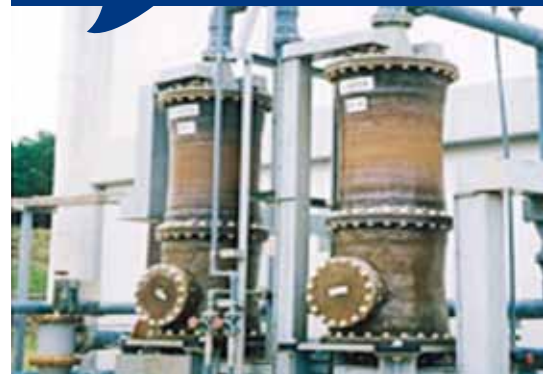
Figure 1 - Exemple d'électrolyseur industriel

Ce procédé se déroule dans un électrolyseur industriel (cf. figure 1 ci-contre) en solution aqueuse ou possédant des sels dissous qui donnent aux ions la possibilité d'un échange entre les deux électrodes.