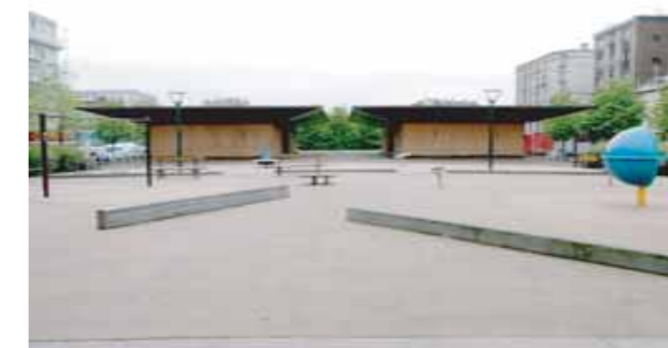
Locaux de ventilation des tunnels