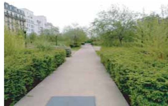
Aménagement d'une tranchée couverte en milieu urbain