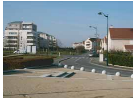
Aménagement d'une tranchée couverte en milieu urbain