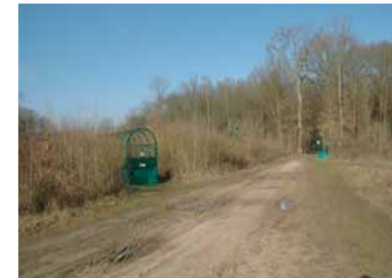
Issue de secours dans la forêt de Saint-Germain-en-Laye