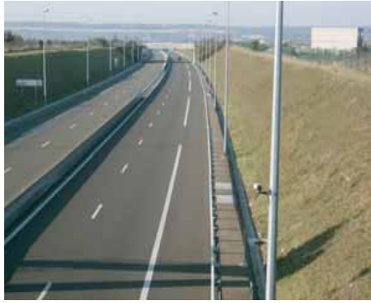
Section d'autoroute en déblai