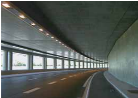
Section d'autoroute semi-couverte