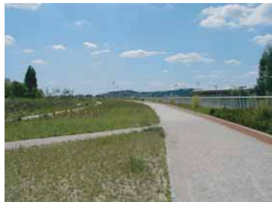
Aménagement d'une semi-couverture en milieu urbain