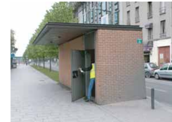
Issue de secours en milieu urbain