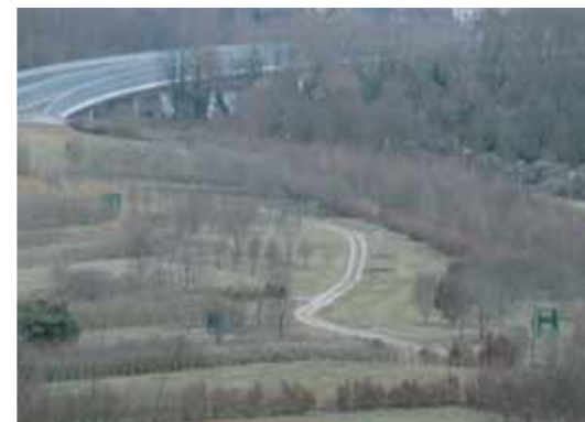
Aménagement d'une tranchée couverte en milieu rural