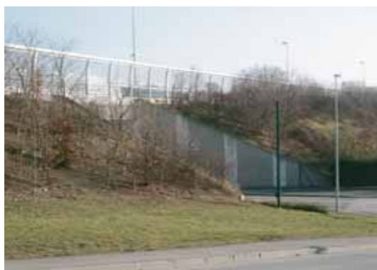
Remblais avec protection phoniques