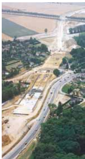
Vue aérienne des travaux