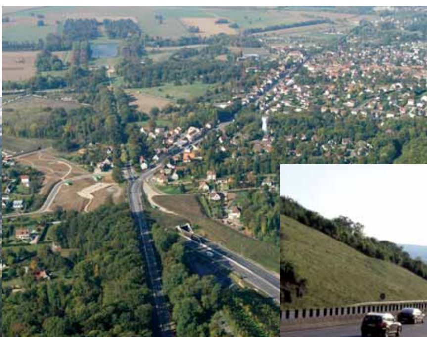
Vue aérienne de l'infrastructure réalisée