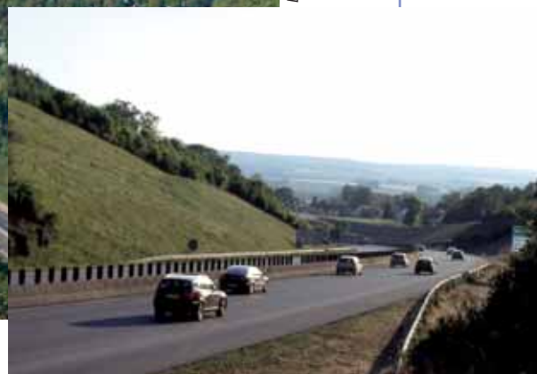
Vue du sol