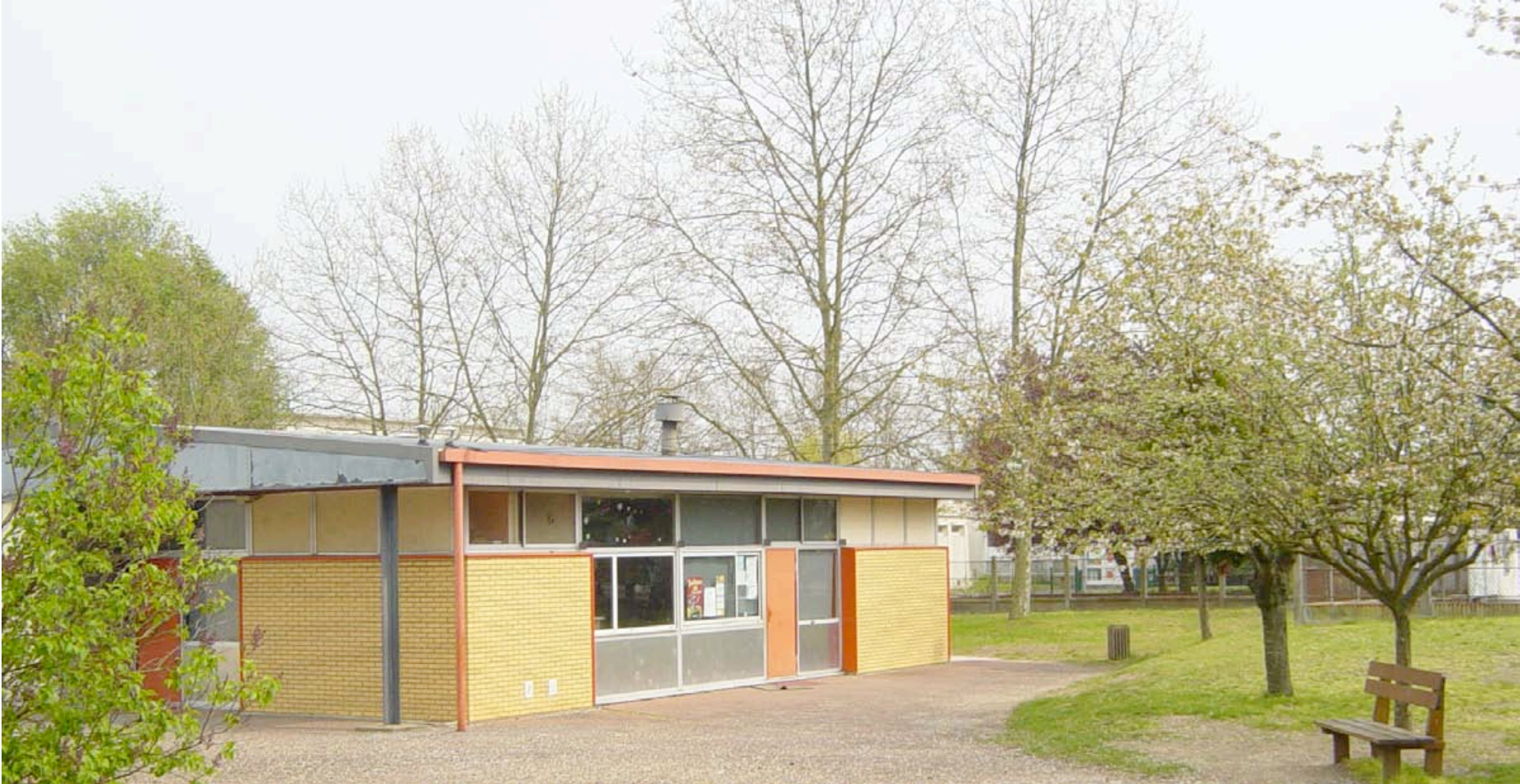
CENTRE AERE DES GRANDES TERRES