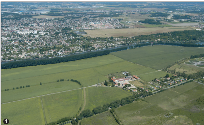
1 Parc agricole d'Achères, ferme du barrage.