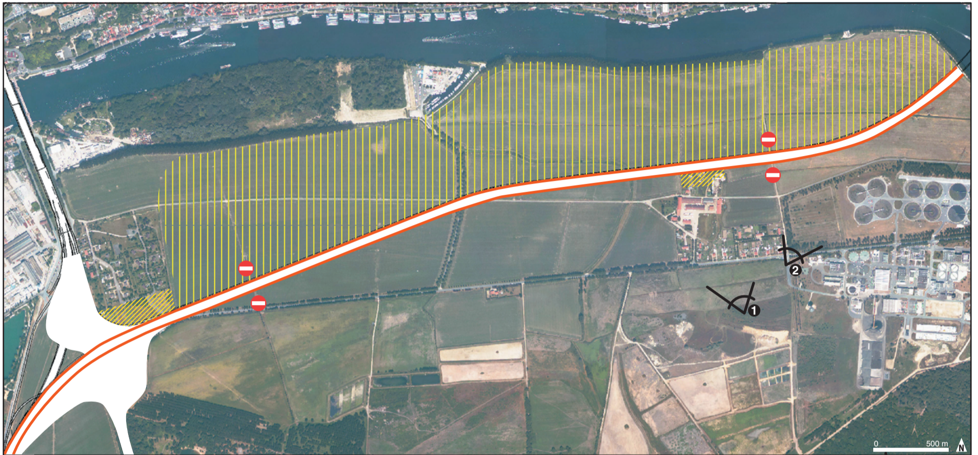
Emprise totale Barrière physique infranchissable Création d'espace difficilement, voire non gérable Impact sur la gestion/accessibilité des terres agricoles Liaison existante interrompue Prise de vue