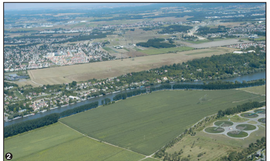
2 Parc agricole et station d'épuration des eaux usées d'Achères; la Seine; la plaine de Pierrelaye.

Cette séquence traverse le paysage ouvert du parc agricole d'Achères. Son passage prévu en remblais entraîne une destruction de la morphologie du site – plaine alluviale de la Seine – et le morcelle, ce qui induit la perte de son unité.