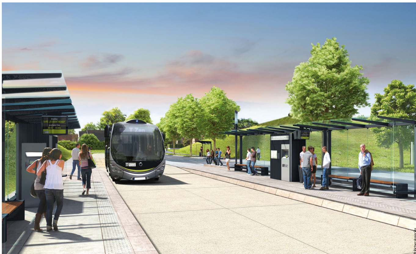
La première ligne du TZen en Ile-de-France reliera dès juin 2011 les gares RER de Corbeil-Essonnes et de Lieusaint-Moissy.