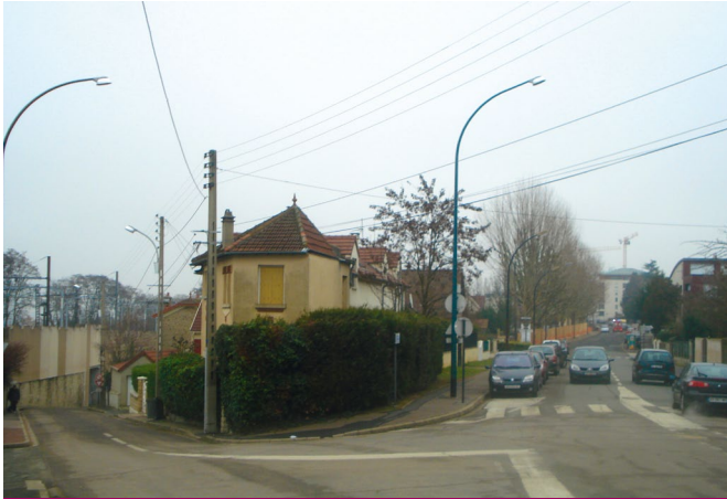
Ici, en zone urbaine, dans le quartier du Noyer Doré en cours de processus ANRU, RFF envisage d'implanter le tunnel d'interconnexion sud, inacceptable pour les riverains !

échanges intermodaux fer-air à la gare TGV d'Orly pour 32 millions de passagers aériens. Par ailleurs, il est illusoire de penser que la structure des dessertes aériennes sur Orly pourrait se modifier : on ne fera heureusement pas d'Orly, qui est très fortement insérée dans le tissu urbain et donc soumise à un couvre-feu entre minuit et 6 heures, un second aéroport intercontinental parisien.