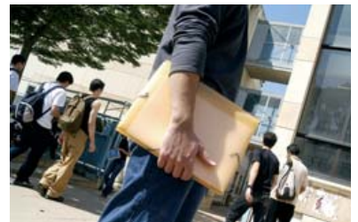
Le Pays d'Aix entend impulser une dynamique gagnante de l'économie de la connaissance.

C'est pourquoi la CPA s'est activement engagée pour la mise en place de la Cité de l'énergie à Saint-Paul-lez-Durance et dans le fonctionnement des pôles de compétitivité.