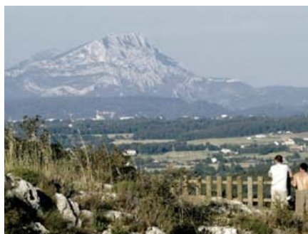
Pour le Pays d'Aix, ITER est une opportunité dans le respect de son cadre de vie.

ITER s'implante sur un territoire en plein renouveau: le Pays d'Aix. Dans une économie déjà largement caractérisée par les hautes technologies, les 34 maires de la CPA ont unanimement décidé de dégager une enveloppe de 75 millions d'euros sur 10 ans (viabilisation du site, bâtiments annexes, dossiers de sûreté, concertation publique, et enfin financement de la construction de la machine).