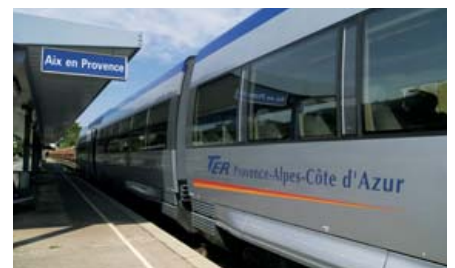
Une occasion pour mettre en œuvre des transports express entre Marseille et Gap.

Déjà et dans la dynamique impulsée par le