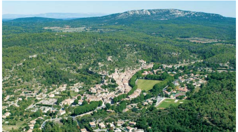
L'étalement urbain devra être remplacé par une démarche proposant un habitat respectueux de l'environnement.

Pour cela, les communes du Val de Durance ont délimité des périmètres provisoires de