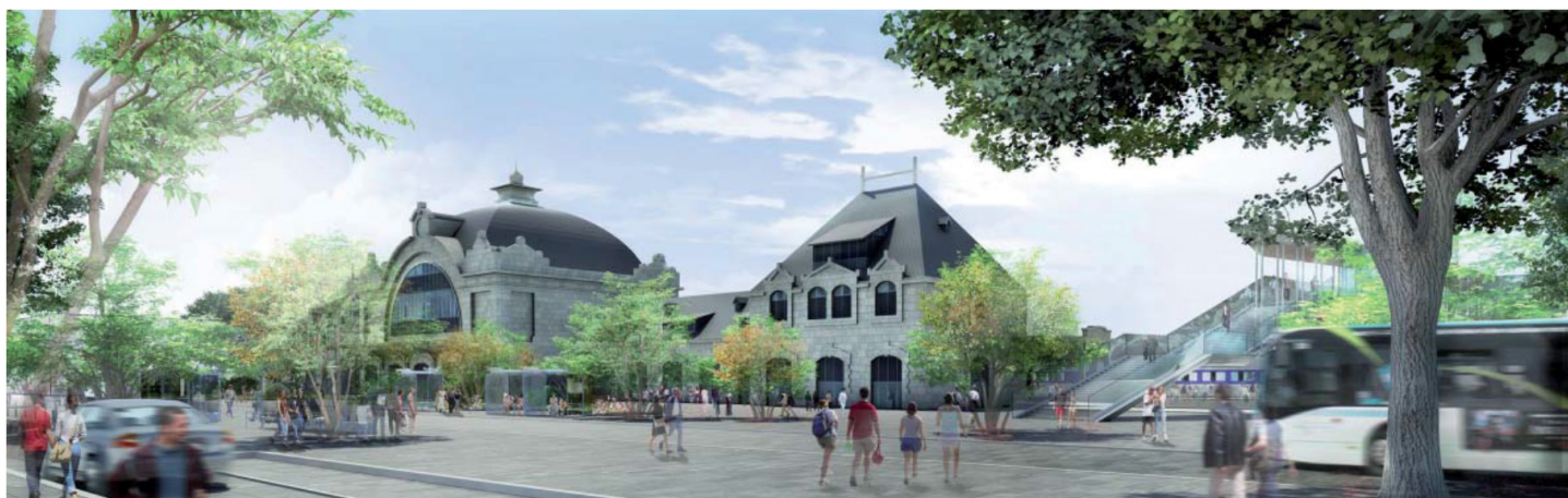
Esquisse issue du concours de maîtrise d'œuvre du PEM : Atelier Villes et Paysages

aux PEM : les arrêts en gare de St-Brieuc, mais également à Lamballe, doivent être maintenus. L'intermodalité pensée localement (mise en service du Bus à Haut Niveau de service -TEO - en 2018 qui traversera la ville de Saint-Brieuc d'Est en Ouest, desserte par le TUB, le TIBUS...) se doit de prendre le relais du TGV pour desservir des territoires proches (vers le centre-Bretagne). Dans le contexte actuel de transition énergétique, cela semble primordial. Le Pays de Saint-Brieuc entend s'affirmer en tant que pôle intermédiaire au nord de la Bretagne et bénéficier de l'amélioration de l'offre de transport que proposerait le projet LNOBPL.