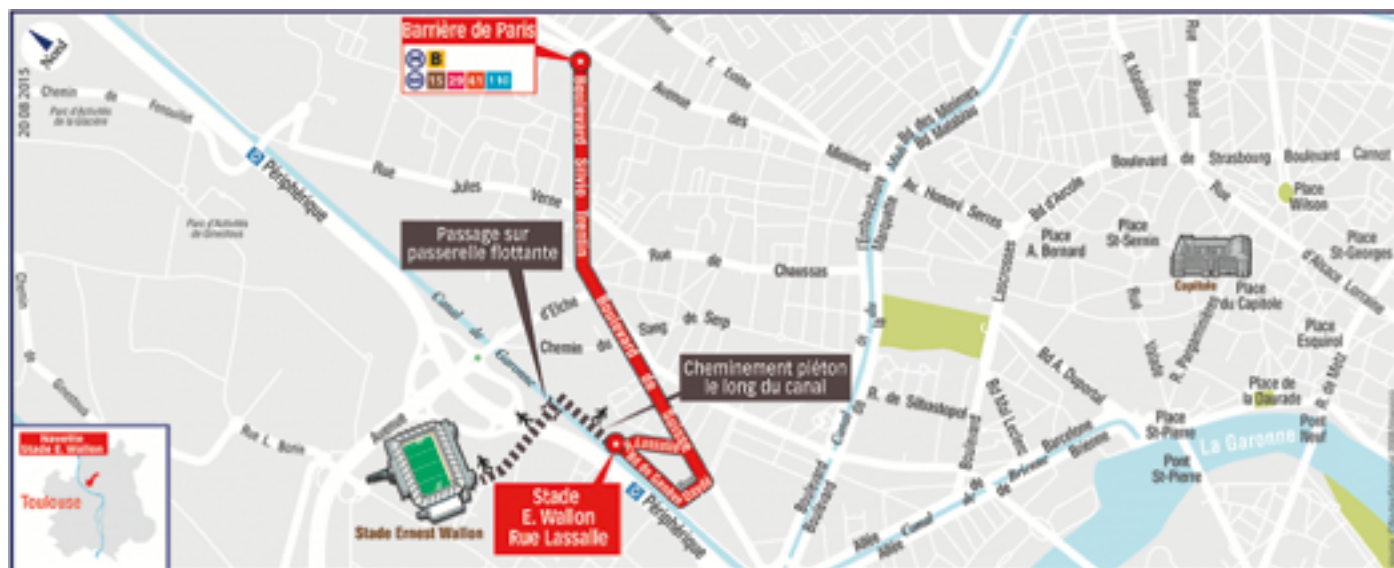
Plan navette TISSEO jour de match

Ci-dessous, le plan des navettes TISSEO mises à disposition pour que les spectateurs puissent se rendre au mieux jusqu'au plus près de la passerelle. Les navettes prennent aujourd'hui un flux d'environ 1500 personnes / match. Ces navettes se voient de plus en plus contraintes de circuler, afin de faciliter les transits, à cause des stationnements anarchiques effectués par les supporters du Stade Toulousain et les riverains du quartier des 7 deniers.