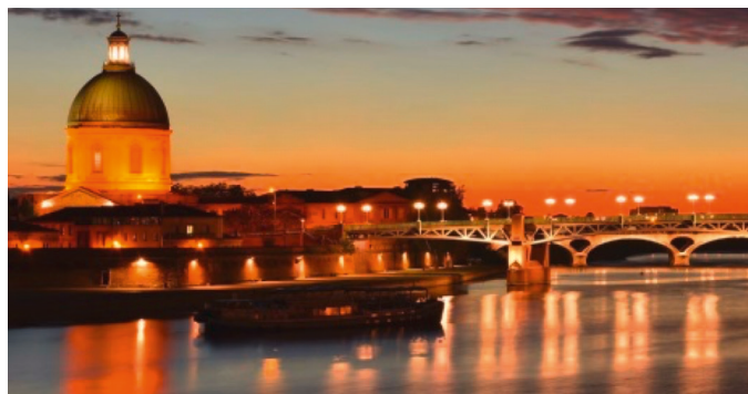
L'enjeu d'image et l'attractivité touristique de la métropole doivent être pris en compte

Il est important que Toulouse et sa métropole confirment leur statut de ville européenne pour contribuer toujours plus à l'attractivité de notre région, qui accueille 15 000 nouveaux habitants chaque année.