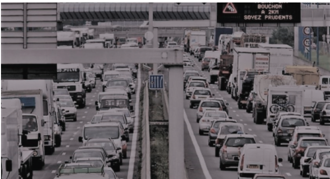
La congestion des grands axes routiers est de plus en plus problématique

Aujourd'hui, 33 000 à 36 000 salariés travaillent sur la zone aéronautique.