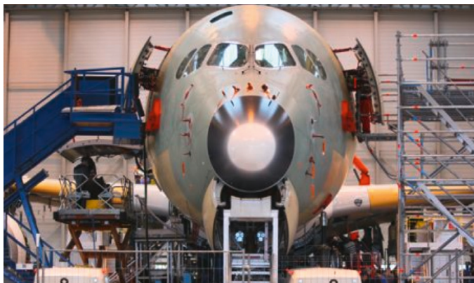
L'attractivité des pôles d'innovation est essentielle

Un investissement important doit être réalisé pour améliorer la mobilité des habitants de façon profonde. La réflexion doit être menée sur le long terme, c'est-à-dire à l'horizon des 20 ou 30 prochaines années. La métropole toulousaine ne peut pas se permettre de manquer l'opportunité qui s'offre à elle. Nos décideurs prouvent aujourd'hui qu'ils souhaitent ne pas commettre les mêmes erreurs qu'il y a quelques années et se montrent attentifs aux demandes et aux besoins de la population.