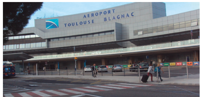
Aéroport Toulouse Blagnac : 5 ème aéroport de France et 1 er aéroport « business »

Il nous semble évident qu'une liaison directe entre la gare Matabiau et l'aéroport doit être installée peu importe la nature de cette liaison (branche ou station sur un tracé unique).