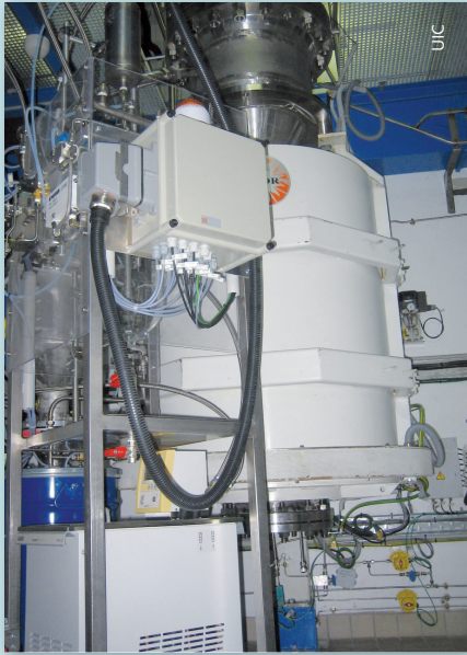
Réacteur pilote pour la production des nanotubes de carbone à Lacq.

part, les Lois ou projet de Lois Grenelle 1 et 2 prévoient la mise en place d'un système de déclaration des nanomatériaux par les entreprises les produisant, les important ou les utilisant, ainsi que d'une méthodologie d'évaluation des risques et bénéfices.