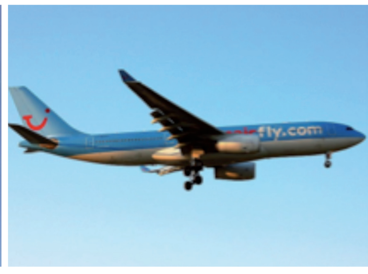
Airbus 330-200 Capacité : 306 à 323 sièges

تَشْوَش نِيغِ چُل ز آفِي ز مَسْفَرِ مِيلِي كُل وَقْتِ