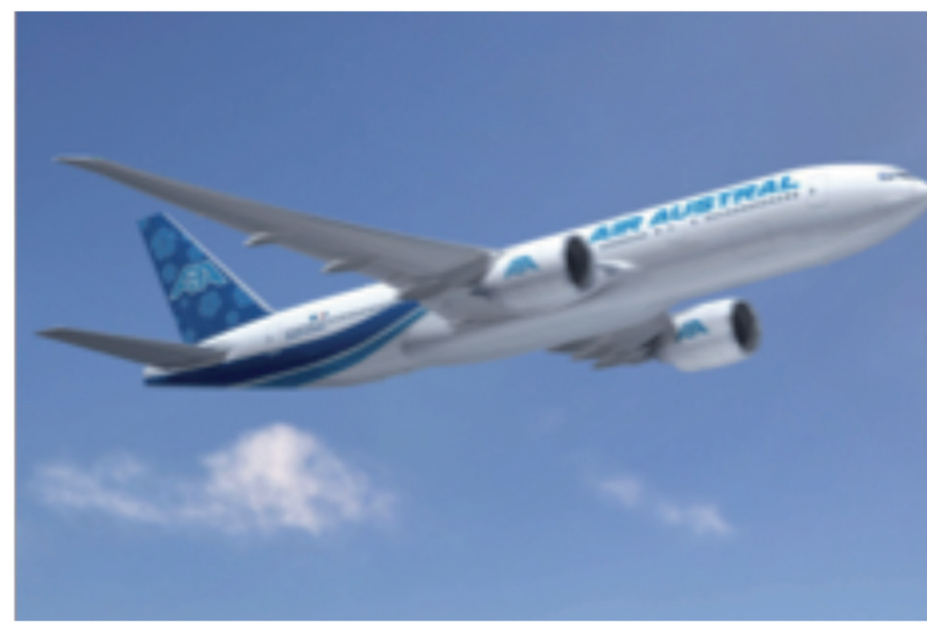
Boeing 777-200 LR Capacité: 364 sièges

زَلِي لُو: پَارِي كِل سَكِرِ آفِي ز مَسْفَرِ مِيلِي