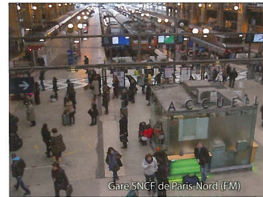
Gare SNCF de Paris-Nord (FM)

• elle regrette que le rapport ne remette pas en cause les orientations de SNCF Mobilités , stratégiques (diversification des activités par croissance externe : création de Ouibus qui concurrence frontalement le train et dont le déficit 2016 atteint 30 millions d'euros, rachat de 45 % du capital de l'opérateur suisse BLS) et commerciales (limitation des fréquences du TGV et concentration des services sur les LGV...) ;