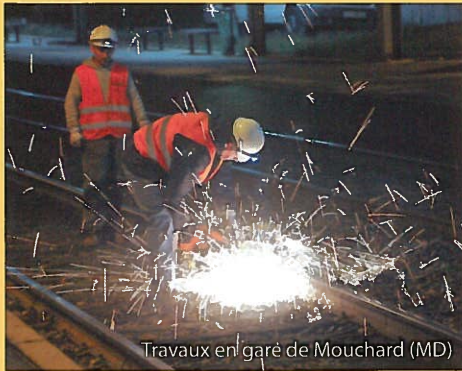
Travaux en gare de Mouchard (MD)

1 - Transposer en droit français le quatrième paquet ferroviaire et définir les conditions de l'ouverture à la concurrence entre opérateurs ferroviaires.