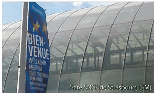
Gare SNCF de Strasbourg (FM)

Louis Gallois, alors président de la SNCF, ne voulait pas de la LGV Est. Plus récemment, la SNCF s'est opposée à la LGV Tours-Bordeaux, redoutant un déficit d'exploitation. Ces deux LGV auront pourtant apporté au rail une importante clientèle nouvelle.