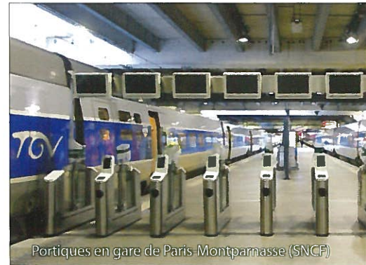
Portiques en gare de Paris-Montparnasse (SNCF)

Enfin il sera peu efficace si, sur un itinéraire