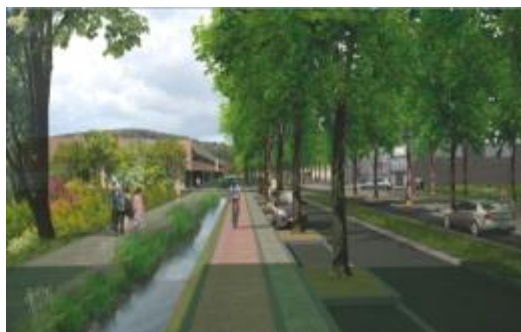
Un port ouvert sur la ville