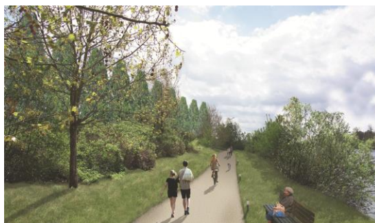
Des berges aménagées pour tout public