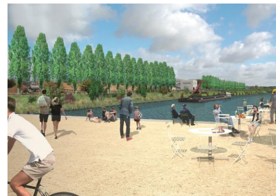
Un centre de vie en bord de bassin intérieur