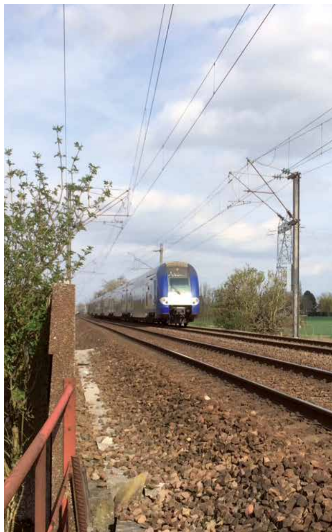
Ligne Arras-Douai au niveau du franchissement du TGV et de l'A1