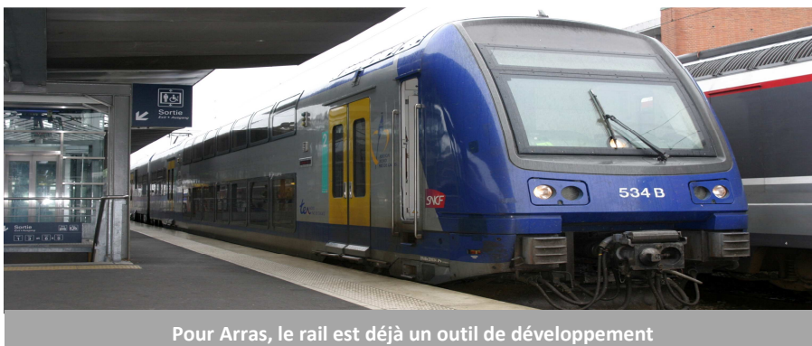
Pour Arras, le rail est déjà un outil de développement