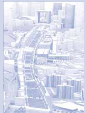
Projet Seine Arche

Ce point nous paraît d'autant plus important que le projet en cours « Arche de la Défense-Seine », qui prévoit 200.000 logements et 300.000 m 2 de bureaux va transformer de manière considérable, et à l'heure actuelle très imprévisible, les flux de transports sur toute cette zone des Hauts de Seine.