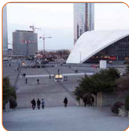
Une solidarité pour un cadre de vie agréable

Les Verts du 92 réaffirment ici l'un de leurs fondamentaux écologiques : favoriser d'autres modes de transports que la voiture afin de réduire la pollution et ses conséquences néfastes en termes de santé publique.