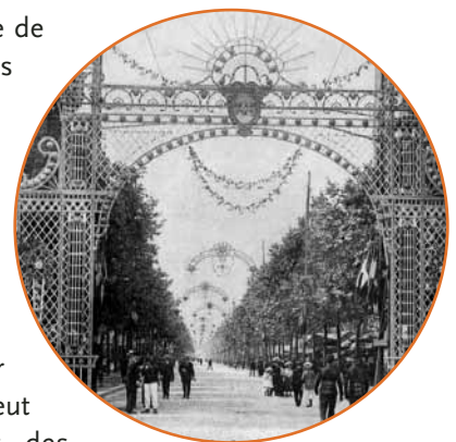
La fête à Neu-neu sur l'avenue : et demain?

Cela signifie un projet urbain fondé sur une esplanade de promenade piétons et vélos avec le maintien des voies latérales pour les bus et la circulation automobile locale à vitesse limitée à 30. L'espace central sera traité en lieu de rencontres locales, régionales ou nationales en continuité de Paris et en direction de La Défense où de grandes manifestations artistiques, musicales et festives mêlant spectacles professionnels de qualité et rencontres associatives de pratiques vivantes amateurs. Comme à La Défense et aux Tuileries, il pourrait y avoir des utilisations diverses et variables dans le temps. Il peut localement permettre l'extension du marché et des animations devant le théâtre actuel.