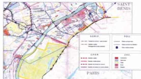
Des transports en commun à renforcer