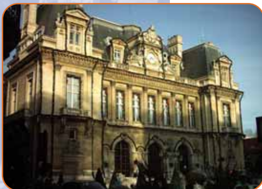
La mairie de Neuilly-sur-Seine

La question du financement de ce projet est très importante compte tenu du coût de cette opération évaluée à près d'un milliard d'euros. La ville de Neuilly au potentiel fiscal considérable ne peut faire appel à la solidarité sur son territoire sans faire un effort conséquent pour le financement de l'opération dont elle tirera directement des avantages en terme de qualité de vie et gain d'espaces. Elle doit être solidaire des communes aux sorties