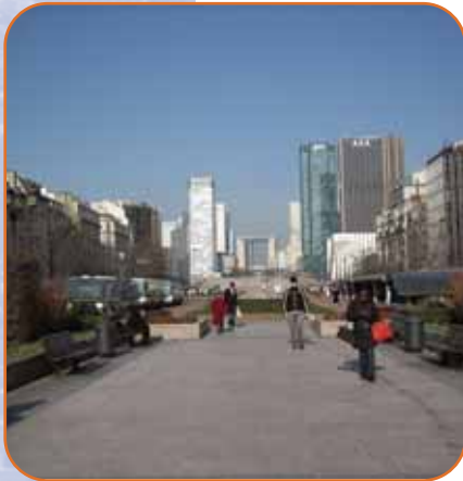
Un espace libre d'animation

Les Verts souhaitent un aménagement en mail continu, planté, large et dégagé. Ils sont favorables à l'absence de constructions lourdes sur l'espace de l'avenue ainsi libéré et à la conservation des quatre alignements de platanes. Ils considèrent que la réalisation d'échanges en entrées et sorties entre les tunnels et la ville par des rampes doit être abandonnée car source d'accidents, coûteux, inutile, nuisant et faisant obstacle au projet urbain de rapprochement des quartiers de la ville.