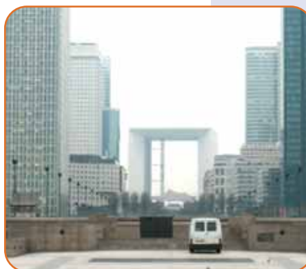
Les grandes entreprises à proximité

Sur le plan financier, il ne faut pas, en effet que ce projet vienne épuiser les lignes d'investissements publics pour les transports en Île-de-France. Des économies doivent impérativement être recherchées et des solutions moins ambitieuses réalisées d'autant plus que le trafic automobile doit être réduit pour l'environnement et en perspective de la crise de l'énergie. Il faut d'abord mettre à plat les études financières et notamment le coût des différentes alternatives et des économies possibles pour ne pas se lancer dans un projet démesuré. L'idée serait de commencer par un tunnel de sortie pour évacuer les voitures de la ville dans un premier temps de façon à déjà réduire la coupure.