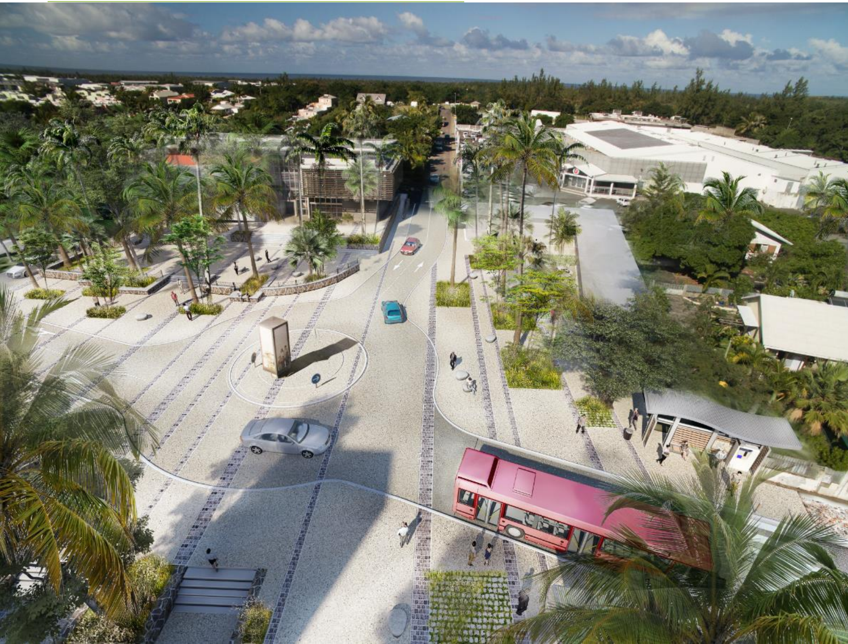
Néo, le Bus à Haut Niveau de Service du territoire de la CIVIS.