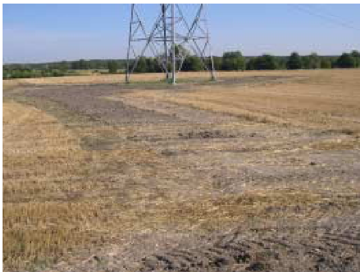
Remise en état des terres