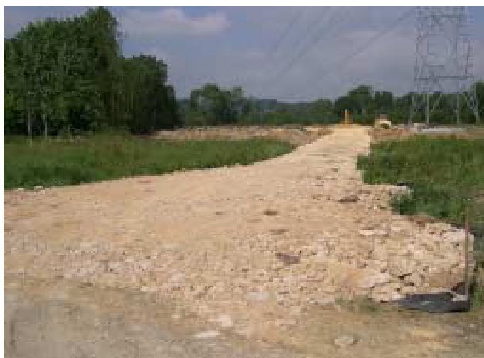
Piste d'accès pylône

La terre végétale est mise de côté, puis un géotextile est placé avant dépôt des pierres de la piste, qui sont d'origine locale.