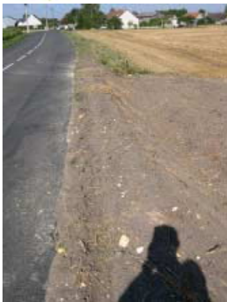
Remise en état d'un fossé