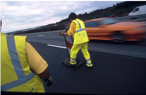
Ouvriers autoroutiers ASF en intervention

Ce phénomène se conjugue à un problème de sécurité des personnels chargés d'intervenir sur l'autoroute. Si l'on observe une nette amélioration de l'accidentologie des usagers (1 900 accidents sur A7 et A9 en 2005, contre plus de 2 000 il y a 5 ans), les conditions de travail et de sécurité de nos personnels se dégradent progressivement. En 2005, on a relevé sur notre réseau 40 heurts de véhicule d'intervention stationnant sur la bande d'arrêt d'urgence (soit près d'un par semaine) dont plus de 15 sur A7 et A9.