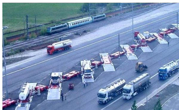
Vue du système de régulation des vitesses sur A7

Son impact reste très modeste puisque cela ne représente que 0.6 % environ du trafic PL enregistré en moyenne sur les sections les plus chargées de l'A7 et de l'A9 en 2005. A périmètre constant des infrastructures ferroviaires, ce sont 3 à 6 allers-retours par jour que l'on peut espérer au mieux à court terme.