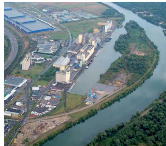
Nouveau port de Metz