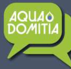
Table ronde 2 : Les forages