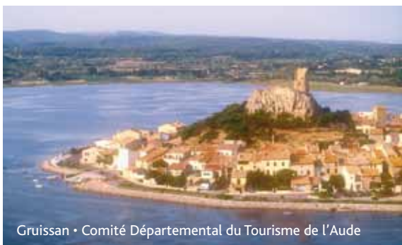
Gruissan • Comité Départemental du Tourisme de l'Aude

Les récentes tensions observées avec les départements voisins doivent nous inciter à concrétiser cette recommandation indépendamment de la réalisation d'"Aqua Domitia".