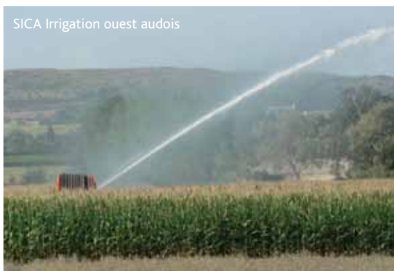
SICA Irrigation ouest audois

Ces rappels de l'histoire témoignent que l'eau dans ce département est un outil incontournable du développement du territoire et que tous les efforts d'investissements n'ont été rendus possibles que par une gestion collective et concertée de l'eau, si bien qu'elle fait aujourd'hui partie intégrante de la culture audoise.