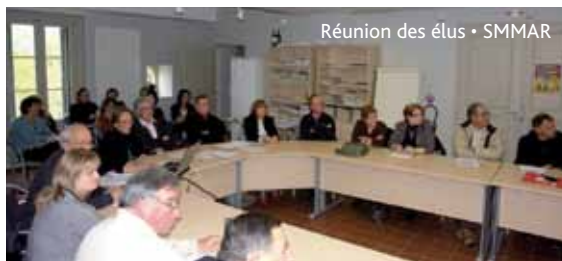
Réunion des élus • SMMAR

Les économies d'eau obtenues par les changements de pratiques ou la limitation des fuites sur réseaux ne sont pas en mesure d'assurer durablement l'équilibre entre la ressource et les besoins dans les années les plus sèches (il convient toutefois de les encourager).