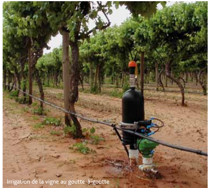
Irrigation de la vigne au goutte-à-goutte

Le territoire d'Arterris couvre plusieurs grands bassins de culture. C'est un vaste espace de 300 000 hectares où se développent les différentes filières de production. Pour préserver les liens de proximité auxquels nous sommes très attachés, notre activité est structurée autour de 7 territoires reconnus pour leur spécificité.