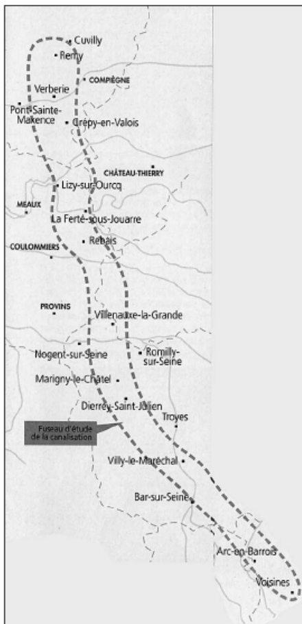
Le projet de canalisation vise à transporter du gaz naturel entre Cuvilly (Oise) et Voisines (Haute-Marne). Le tracé n'est pas encore décidé. Seul un fuseau d'étude très large est à l'ordre du jour.