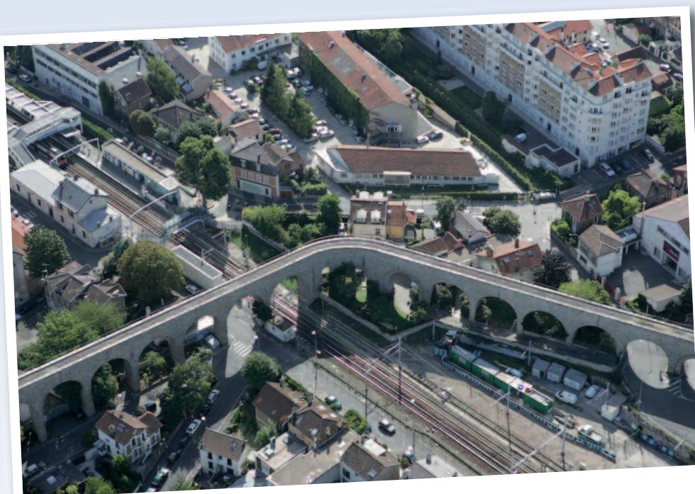
Gare d'Arcueil-Cachan et Aqueduc de la Vanne.