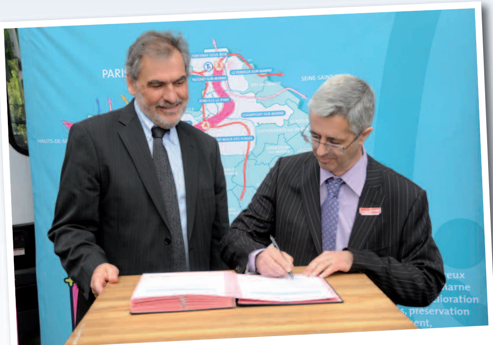
24 juin 2009 : adhésion du Club à Orbival.

Le Club Val de Bièvre Entreprises est membre depuis juin 2009 de l'association Orbival et fait partie de son conseil d'administration. Le trajet et les stations d'Orbival sont repris pour l'essentiel dans les deux projets Arc Express et Grand Paris.