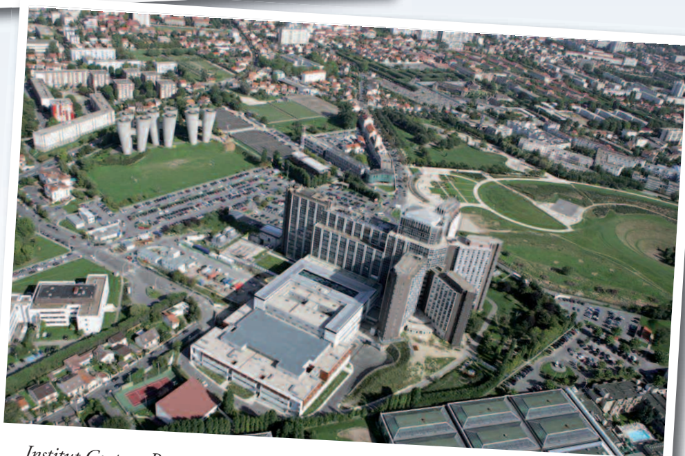
Institut Gustave Roussy à Villejuif.