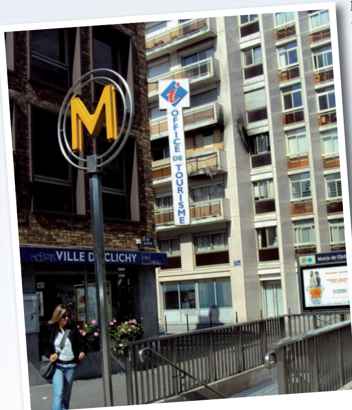
Station de métro Mairie de Clichy

La station de métro Mairie de Clichy est la seule desservant le territoire de Clichy, c'est-à-dire 59 000 habitants, alors que les 17 e et 18 e arrondissements de Paris bénéficient d'une station pour 10 000 habitants. Cet écart significatif est aggravé par les problèmes de saturation affectant la ligne 13 , d'ailleurs bien connus : une situation intenable aux heures de pointe avec une densité pouvant atteindre 4,5 personnes/m 2 , des conditions de transport très inconfortables, de nombreux incidents techniques et des risques en termes de sécurité.