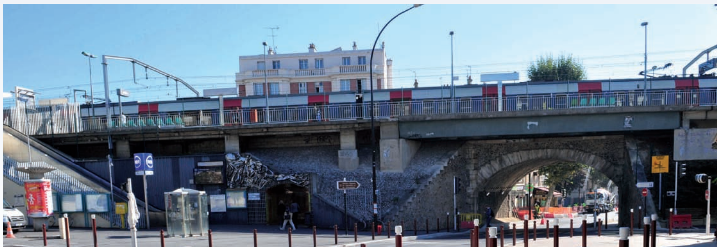
Gare RER de Cachan