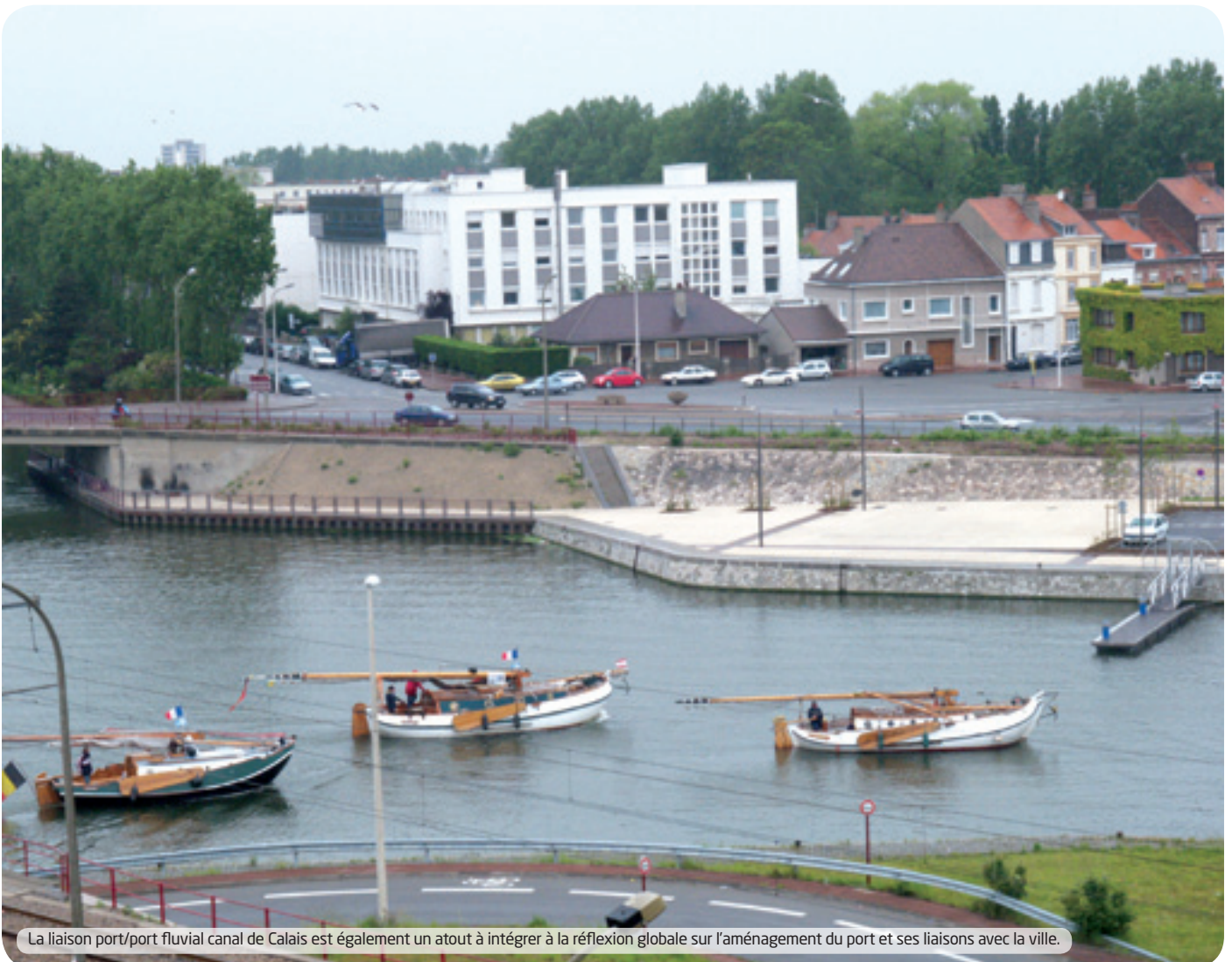
La liaison port/port fluvial canal de Calais est également un atout à intégrer à la réflexion globale sur l'aménagement du port et ses liaisons avec la ville.

> Mise en place d'une desserte directe par bateau de type fluviomaritime (gabarit de 1.500 T à 3.000 T) prenant la mer à Calais et remontant la Seine au Havre pour livrer directement les pondéreux en Ile de France.