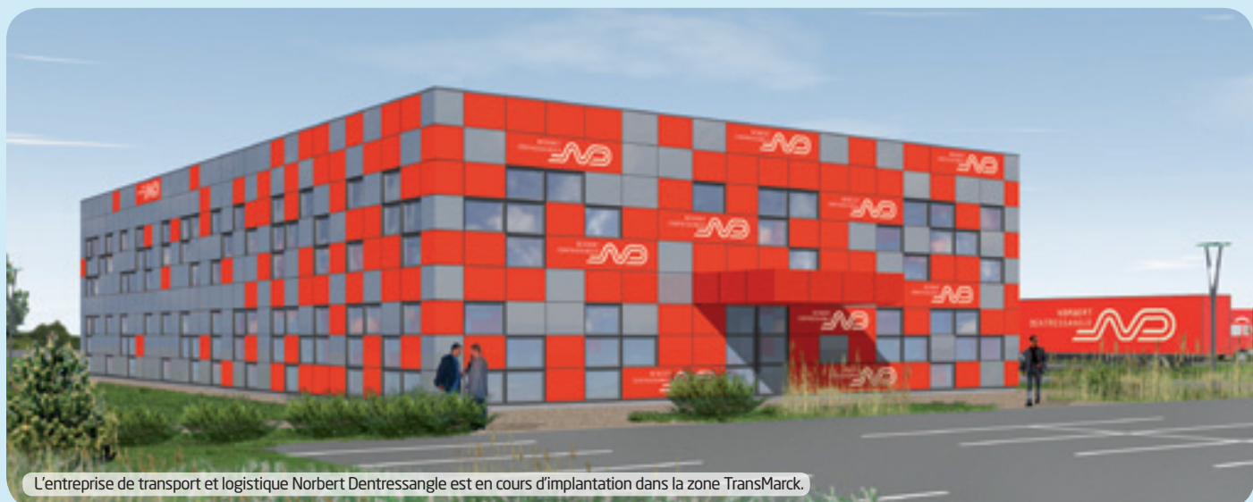
L'entreprise de transport et logistique Norbert Dentressangle est en cours d'implantation dans la zone TransMarck.