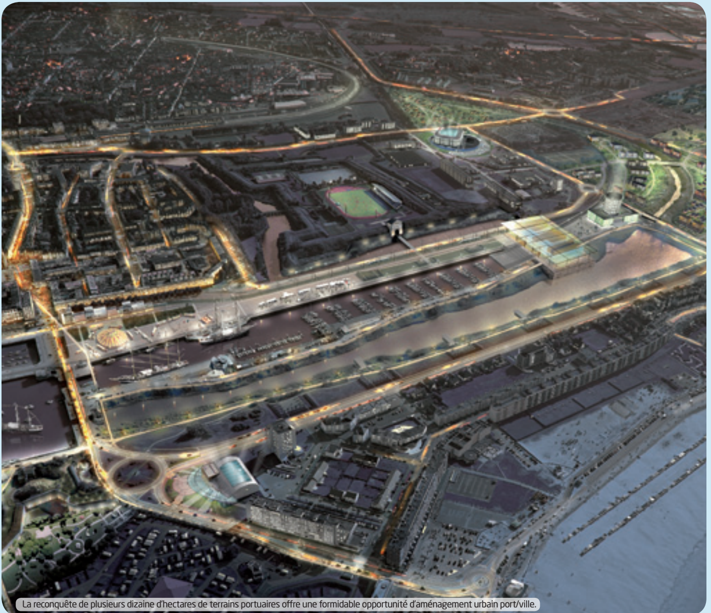
La reconquête de plusieurs dizaines d'hectares de terrains portuaires offre une formidable opportunité d'aménagement urbain port/ville.