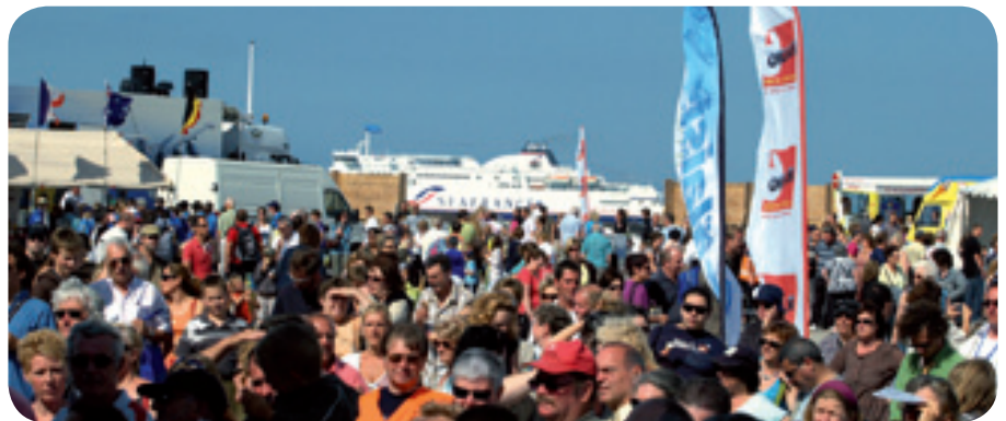
Le port, la plage et le ballet des ferries, sur fond de grand site national du Cap Blanc Nez offrent une scène magnifique aux grands événements touristiques (ici centenaire de la traversée de la Manche par Blériot).

Calais Port 2015 par son ampleur en période de chantier et de fonctionnement, participera à la dynamique touristique voulue par les élus de l'agglomération : réaliser de l'événementiel de qualité pour améliorer l'attractivité du territoire (Blériot 2009, le Channel, expo Arthus Bertrand...).