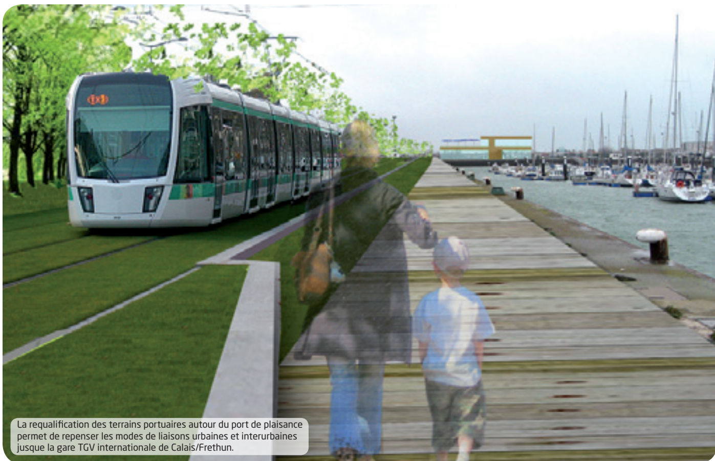
La requalification des terrains portuaires autour du port de plaisance permet de repenser les modes de liaisons urbaines et interurbaines jusque la gare TGV internationale de Calais/Frethun.

réflexion sur un service de bateau/bus. La Communauté d'agglomération souhaite mailler par un transport en commun efficace l'ensemble des pôles d'activités importants du territoire : à ce titre une étude va être engagée pour réfléchir à la création d'une ligne de transport en commun en site propre reliant la gare TGV de Frethun, Cité Europe, le centre ville de Calais, le front de mer et Calais Port 2015.