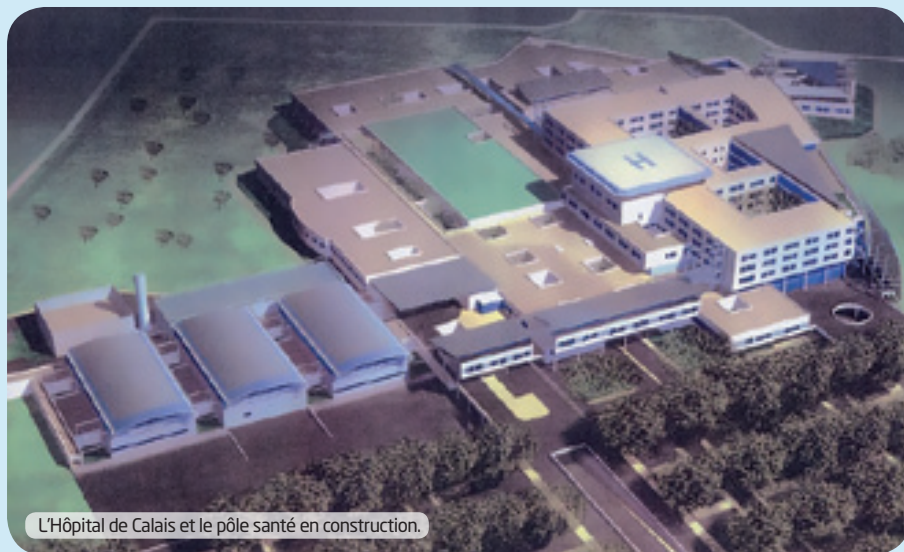
L'Hôpital de Calais et le pôle santé en construction.

Ce cahier d'acteur est une contribution pour mettre en avant la cohérence qu'il peut y avoir entre le territoire et le projet. Il indique comment Calais Port 2015 peut être un nouvel élan pour le Calais. Il analyse, enfin, les impacts majeurs de ce projet en termes économiques, sociaux et environnementaux et l'implication nécessaire de la Communauté d'agglomération dans ces grands dossiers.