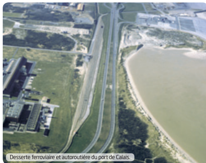
Desserte ferroviaire et autoroutière du port de Calais.

➤ Au plan ferroviaire, la gare de triage positionnée au sud du projet trouvera un nouveau souffle à la jonction du nouveau port et de la ligne Calais-Dunkerque rénovée.