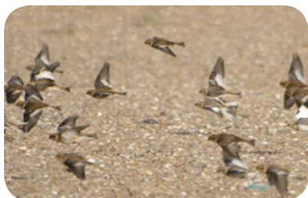
Bruant des neiges

Lors de la réunion du débat public du 29 septembre à Marck, un participant de la salle a suggéré la mise en place d'éoliennes sur