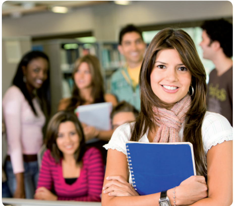
Jeunesse du Nord-Pas de Calais

Calais ont réaffirmé la nécessité de favoriser les coopérations inter-territoires et souligné l'importance d'une construction cohérente des complémentarités et des solidarités entre territoires. Dans ce sens Calais Port 2015 doit être porteur d'une dynamique de solidarité et de respect de l'environnement, devant durablement conduire à l'utilisation rationnelle des moyens existants et leurs potentialités.