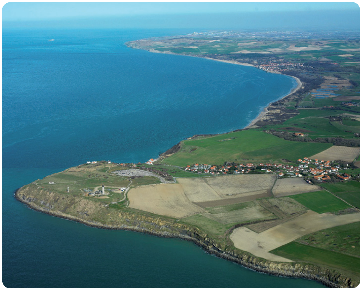
Le littoral Cap Gris Nez

lenge et l'occasion de créer, raisonnablement et solidairement, pour les hommes et les femmes de notre littoral et pour l'avenir de nos enfants, des outils et les conditions d'un développement durable et respectueux de notre environnement.