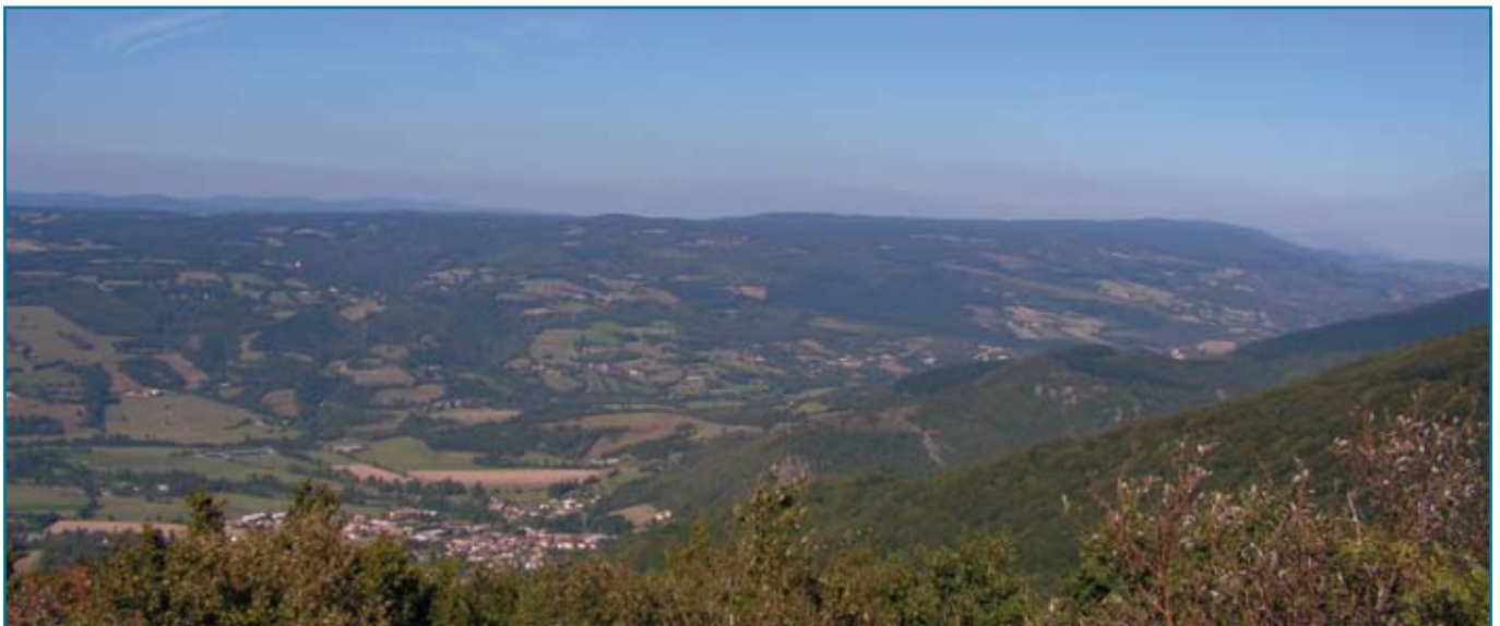
Haute Vallée du Thoré. En contrebas, D612 reliant Mazamet à la Méditerranée

L'amélioration de ce trajet sur sa partie tarnaise viendrait compléter les importants travaux réalisés ou en voie de réalisation sur la partie héraultaise de l'itinéraire.