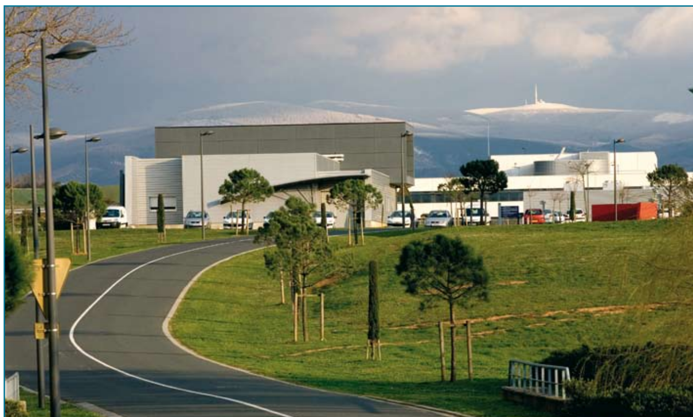
Castres-Mazamet, pôle économique d'équilibre de la métropole toulousaine

(1) CEEI : Centre Européen de l'Entreprise et de l'Innovation