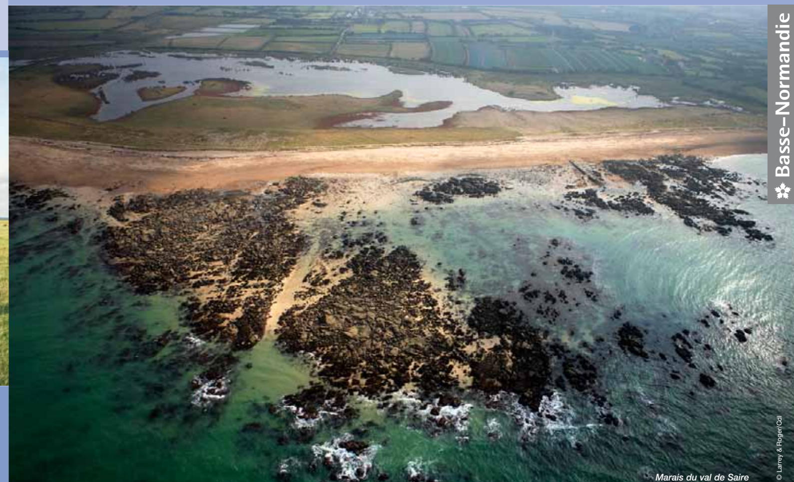
Marais du val de Saire