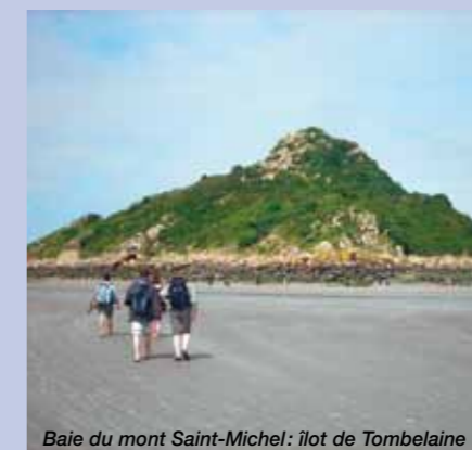
Baie du mont Saint-Michel: îlot de Tombelaine