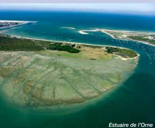
Estuaire de l'Orne