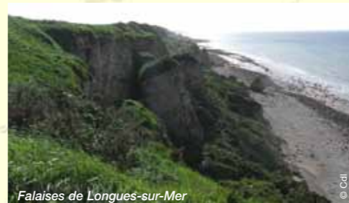
Falaises de Longues-sur-Mer