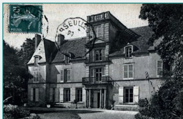
Carte postale montrant le manoir de Bernières avec sa terrasse « vue sur la mer »