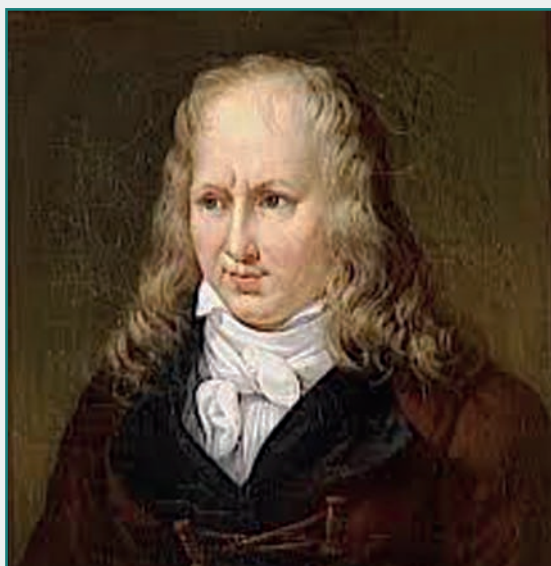
Jacques Henri Bernardin de Saint-Pierre (1737 – 1814)