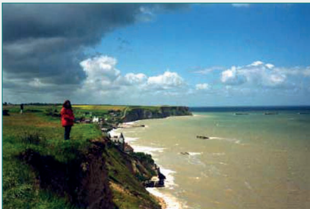
Belvédère de la Croix à Arromanches