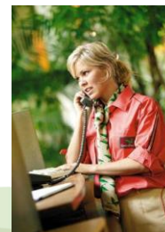
Accueil & Adm