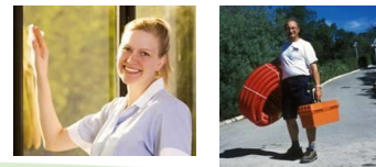
Maintenance & Ménage