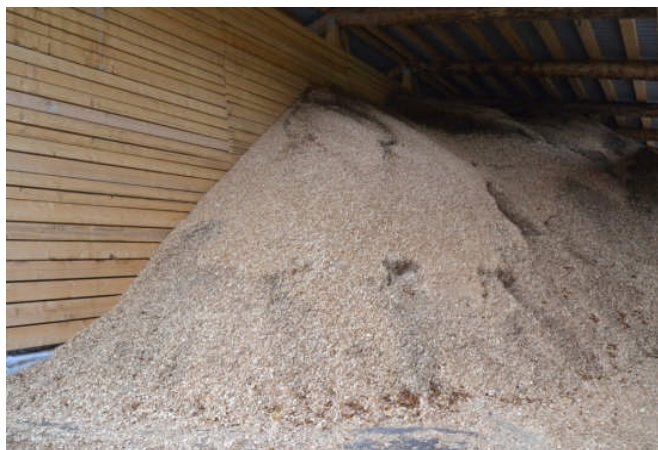
Plaquette forestière sous le hangar de séchage de La Mouille (39)

En outre, il n'y a pas, sur ce secteur, d'installation fortement consommatrice en bois énergie. Il y a donc de la place pour de nouveaux équipements qui pourront être approvisionnés par des circuits de proximité. Cela constitue une vraie opportunité pour localiser l'économie de la filière bois énergie. En effet, des acteurs économiques du territoire ont signifié leur volonté de créer des équipements de production de plaquette forestière en cas d'émergence de marchés pour écouler ces produits.