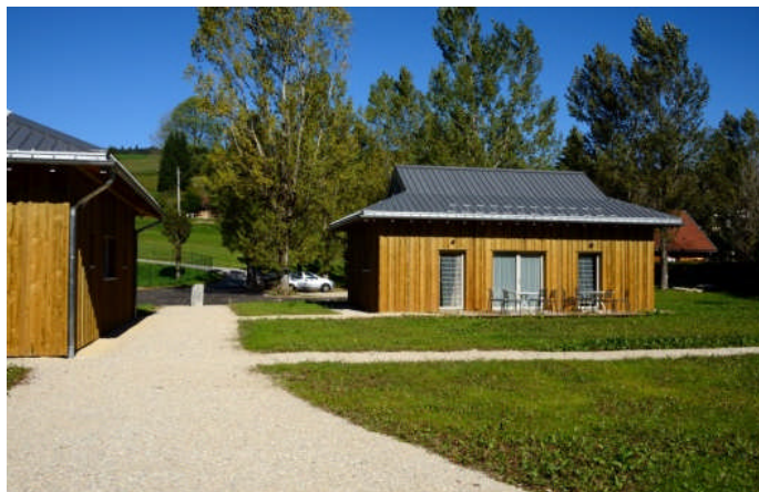
Installations touristiques en bois local à Foncine-le-Haut

Enfin, ce projet constitue une véritable reconnaissance de l'attractivité du territoire (paysage, cadre de vie...) et pourrait contribuer à sa notoriété auprès du grand public.