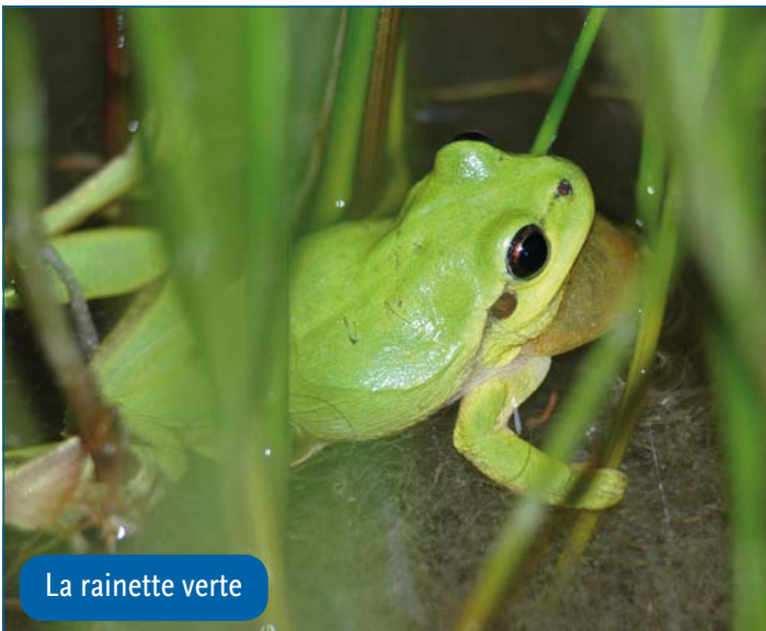
La rainette verte

Les impacts de la construction de ces casiers devront être réduits au maximum et les effets résiduels négatifs devront faire l'objet de mesures compensatoires (création de