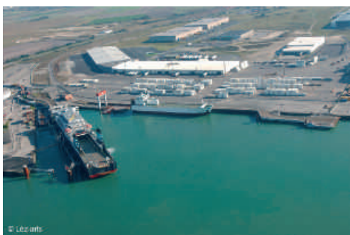
PAD - Conteneurs Frigo

Si notre territoire français fait l'objet d'un maillage au niveau de l'approvisionnement énergétique permettant ainsi à des Entreprises d'avoir la disponibilité normale, la présence sur le territoire Dunkerquois peut être une opportunité réelle d'implantation d'industries fortement consommatrices d'énergies et nécessitant une proximité de la source émettrice notamment par une utilisation importante de gaz naturel pour des productions spécifiques de type électricité et pour certaines activités chimiques.