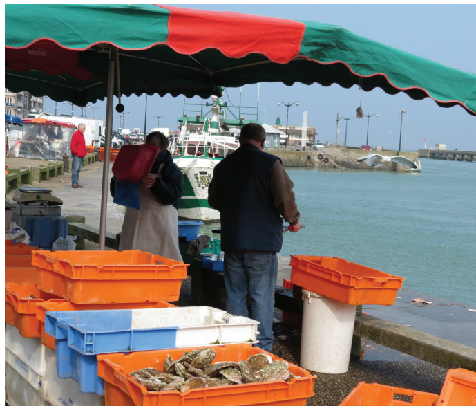
Le port de pêche, situé au coeur de la ville, emploie 240 marins. Une partie du poisson est vendue directement sur le port, pour le plus grand plaisir des habitants et des touristes.

En 2014, le port du Tréport compte 70 navires normands et picards. Ces derniers ont trouvé refuge ici en raison de l'ensablement de la Baie de Somme. 15 ans plus tôt, le port ne comptait que 59 bateaux. 240 marins-pêcheurs vivent directement de cette activité. À ce chiffre s'ajoutent les 800 personnes travaillant à terre et dépendant de ce secteur. Le chiffre d'affaires des bateaux du Tréport s'élève à 11 millions d'euros par an.